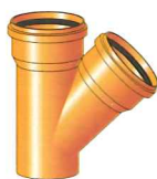
Braga Semplice a 45° Branch 45°